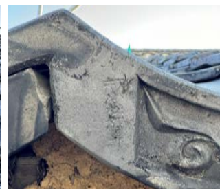
数枚のみ刻印が確認された軒瓦