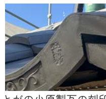
とがの小原製瓦の刻印