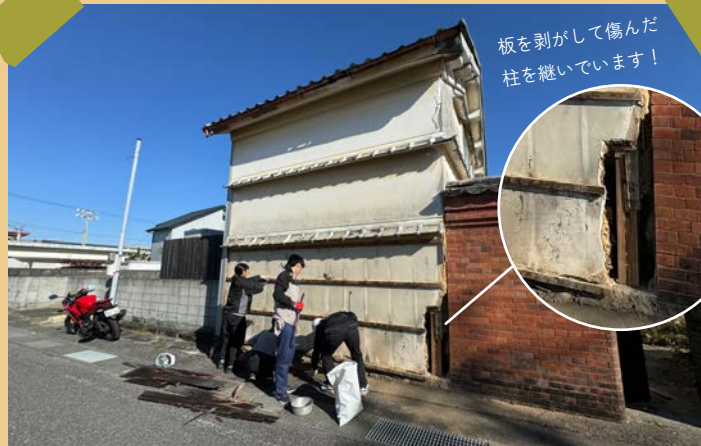
板を剥がして傷んだ柱を継いでいます!