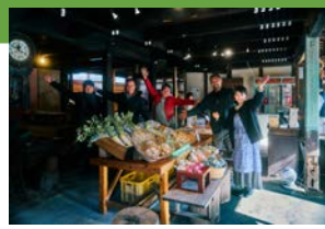
これから農家さんは夏野菜の準備に向けて大忙し!全力で応援しましょう~!