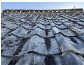
刻印が見当たらない平瓦

なのでしょうか・・・まだ謎は解けていませんが、これまで見えていなかった部分が見えたことは大発見でした。追い追い、窯元について調べて行きたいと思います!