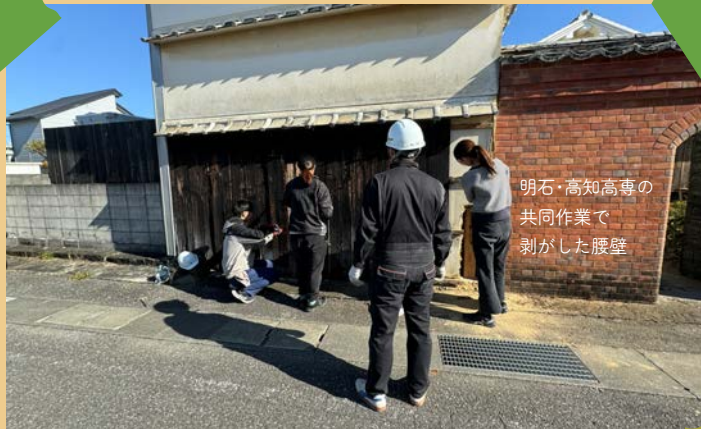
明石・高知高専の共同作業で剥がした腰壁