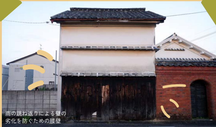
雨の跳ね返りによる壁の劣化を防ぐための腰壁