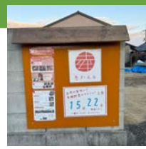
見やすい掲示板ができました!最新情報はここでチェック!