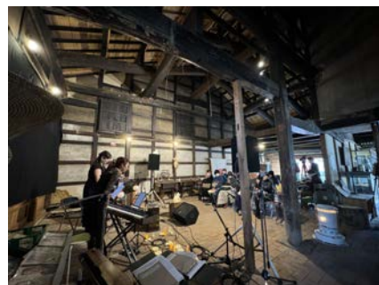
吹き抜ける土間で開催されたコンサート

今年は絵金蔵が開館して20周年!おめでとうございます!! それを記念して1月から2月にかけて絵金蔵では様々な企画が行われていました。 その一つとして、高知県にゆかりのあるアーティストがそれぞれの中に息づく「絵金」を表現する「エキンスタイル」を開催。赤れんが商家では、2/8に一絃琴や三味線、クラシックなどバラエティに富んだ内容のコンサートが開催されました。 パンケーキを召し上がった後にコンサートを聞く方も複数おられ、よいコラボができました。絵金蔵のみなさん、企画・演者のみなさん、聞きにきてくださった皆様、寒い中、ありがとうございました!