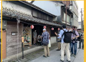
高専生・大学生による芝居絵解説も復活しました。