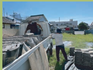
2トントラックで佐川町まで瓦をもらいに行ってきました！

今回の屋根修繕では、瓦を再利用する予定ですが、割れや劣化がみられる瓦は使えないため、瓦が不足しています。そのため、県内各地から古瓦をご提供いただいています。今回は佐川町にて改修を行う古民家からいただきました！ご提供くださり、ありがとうございます！なお、まだ「右瓦」が不足しております。古い瓦をまとめて保管している、瓦を下ろす予定があるなど、情報がございましたらぜひご連絡ください！