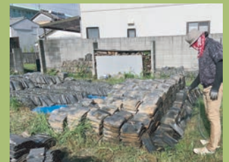
WS以外の日も、時間のとれる日には瓦の洗浄作業を進めています。