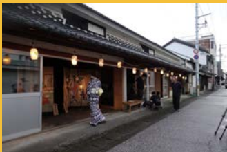
天候のため室内土間への設置でしたが、静謐な雰囲気が漂っていました。