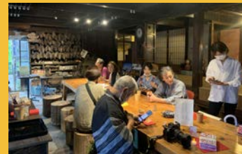
赤れんが商家ではコーヒー・ハーブティをご用意して建物内も見学いただきました。