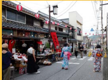
提灯が本町・横町商店街を照し、賑やかなお祭りの雰囲気が戻ってきました！