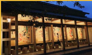
須留田八幡宮では絵金殿での芝居絵(レブリカ)展示が参拝者を迎えていました。

芝居絵屏風は現在、4ヵ年計画で修理を進めており、修理を終えた作品が展示される貴重な機会でもありました。極彩色がよみがえりより一層、芝居絵の迫力を伝えていました。