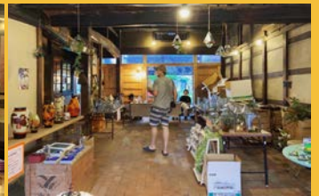
ユーログラス工芸さんのガラス作品で、幻想的な雰囲気が生まれていました。