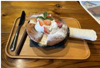
今月はいちごパンケーキ☆

4月のパンケーキカフェと和裁士さんでは、アロマを使ったハンドケア&ハンドクリームづくりを同時開催しました！パンケーキの待ち時間に体験くださる方や、これを目当てにきてくださる方もおり、すてきなゆっくり時間が流れていました。そして、和裁士さんのところには、今月も運針を学びに小さな和裁士さんがきていましたよ(^^)