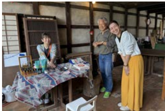
アロマブースをつくってくれました！