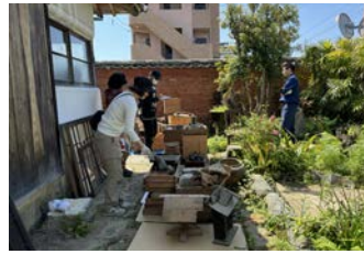
土蔵の荷物を取り出しました！