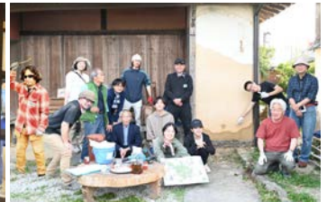
ご参加くださりありがとうございました！