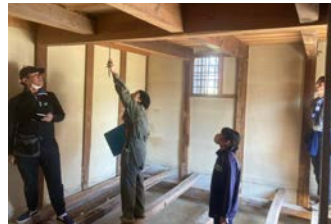
土蔵の痕跡調査の様子