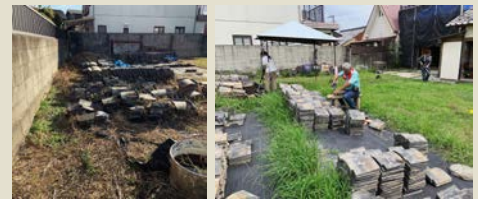
暑くなる前に瓦も整理整頓しよう…!!