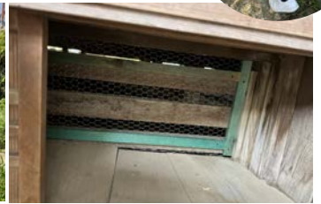
床下に猫侵入防止対策を施しました